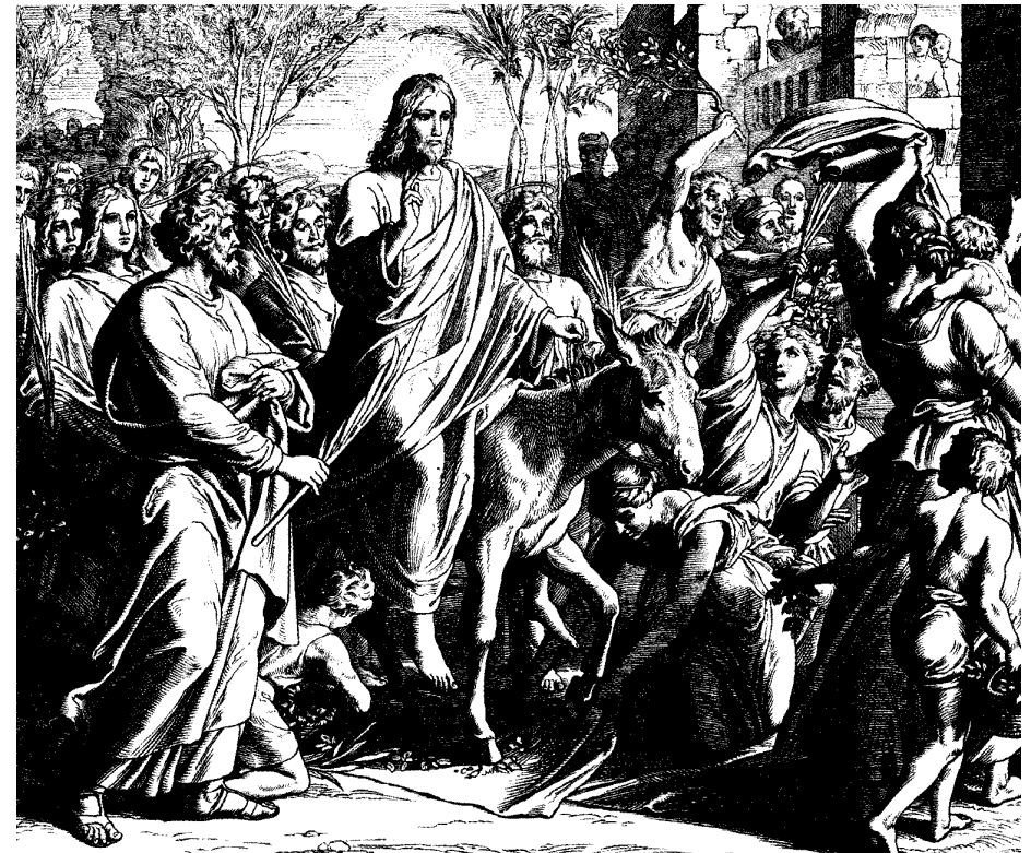
Jesus zieht in Jerusalem ein